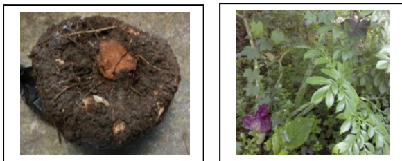
Gambar 1. Umbi Walur (kiri) dan tanaman Walur (kanan), merupakan tanaman lokal Indonesia yang prospektif sebagai bahan pangan pengganti beras

Dalam penelitian ini, dilakukan karakterisasi sifat kimia umbi walur, penetapan nilai indeks glikemiknya, dan eliminasi kadar kalsium oksalat dengan berbagai teknik pencucian.