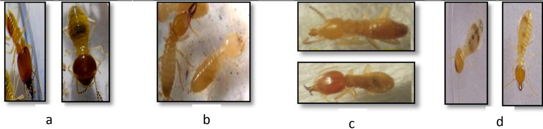
Gambar 2 Foto beberapa spesies rayap yang ditemukan KIJP Pakuwon, yaitu: a) Macrotermes sp., b) Coptotermes sp., c) Schedorhinotermes sp., d) Microtermes sp.

Microtermes sp, spesies berukuran kecil. Prajurit dan pekerja dimorfis. Kepala berwarna kuning muda, rata-rata panjang mandibel 1,1 mm, lebar kepala 1,2 mm, dan antena 16 ruas. Panjang prajurit besar 3,5-4,75 mm, prajurit kecil 3,5-3,75 mm.