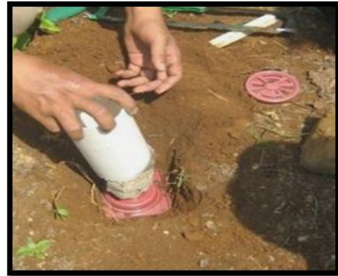
Gambar 1 Stasiun pengamatan dan pemasangannya